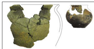
↑ Obr. 2. Dvě zrekonstruované nádoby z naleziště. Vlevo – slovanská nádoba 7. – 8. stol.; vpravo – nádoba č. 3 z halštatského komorového hrobu.