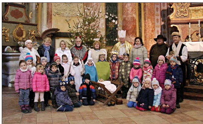
Obrázek č. 1 a 2: Betlémování – Kutná Hora