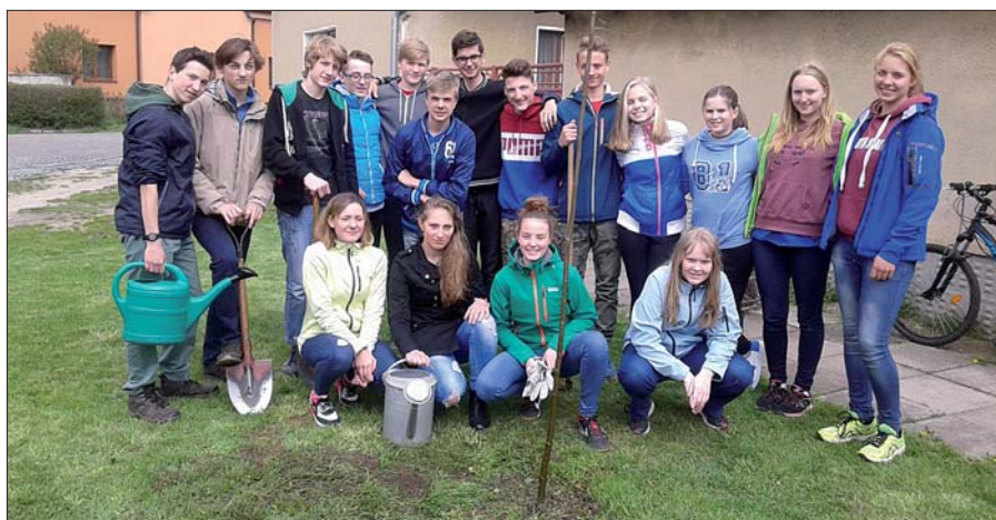
Ještě než opustí brány zdejší ZŠ, rozhodla se devátá třída vysadit si svůj strom.