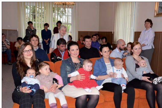
Mezi námi jsme přivítali Prokūpka, Aničku, Otakárka a Edíka...