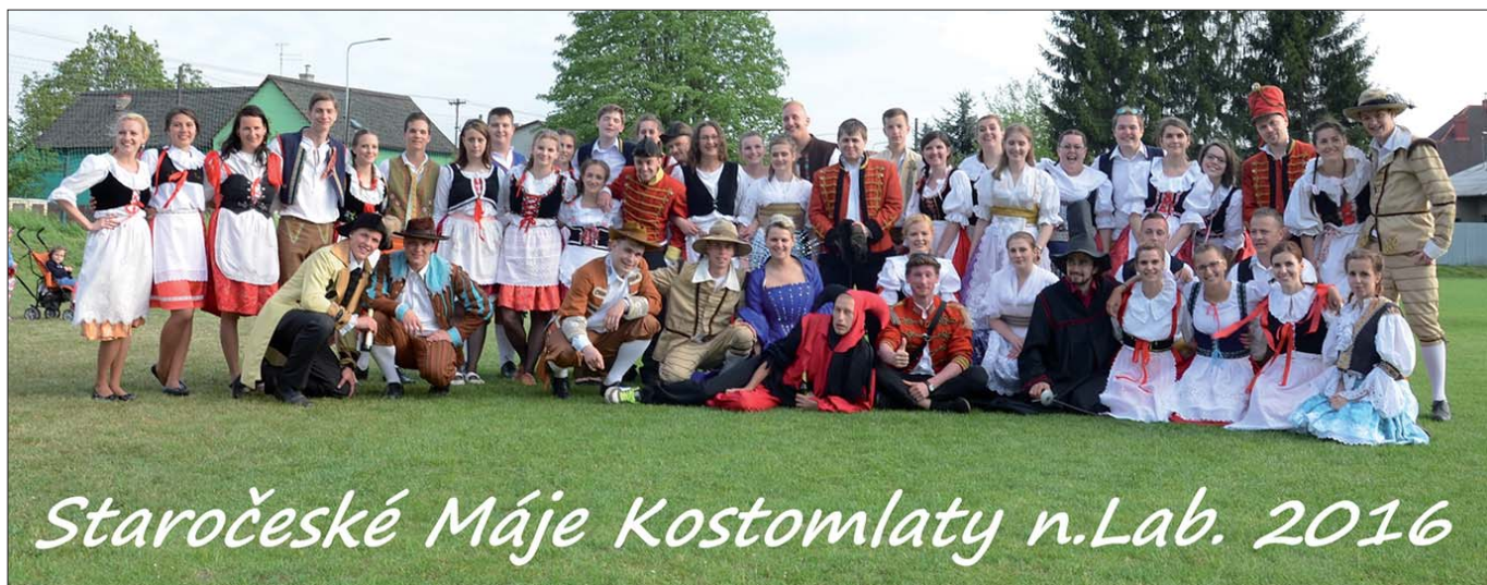
Staročeské Máje Kostomlaty n.Lab. 2016