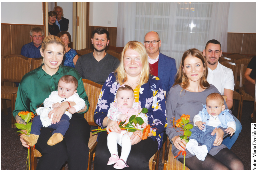
Autor: Marta Dvořáková