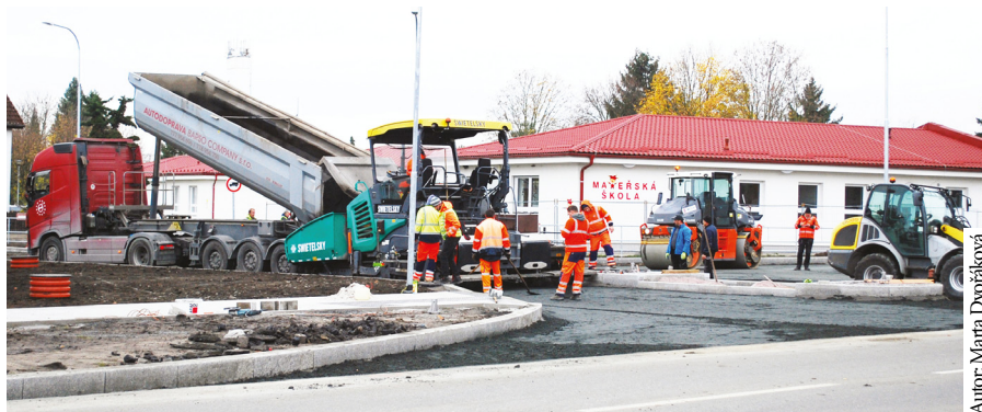
Autor: Marta Dvořáková

V této souvislosti bych opět ráda požádala všechny občany o shovívavost. Výstavbu vodovodu a kanalizace nelze provádět na jiných pozemcích, a proto na mnoha místech docházelo a zřejmě ještě bude docházet k nepříjemným situacím. Nepopírám, že by nešlo něco zrealizovat i líp, ale na všech probíhajících stavbách se bohužel ukazuje problém, spočívající v naprostém nedostatku kvalifikovaných pracovníků. Vezměme si proto z těchto akcí spíše to pozitivní, že se majitelům dotčených nemovitostí do budoucna zhodnotí jejich majetek,lepší se jejich komfort bydlení, a že se v některých obcích mnohým vyřeší i zásadní problém s nedostatkem pitné vody.