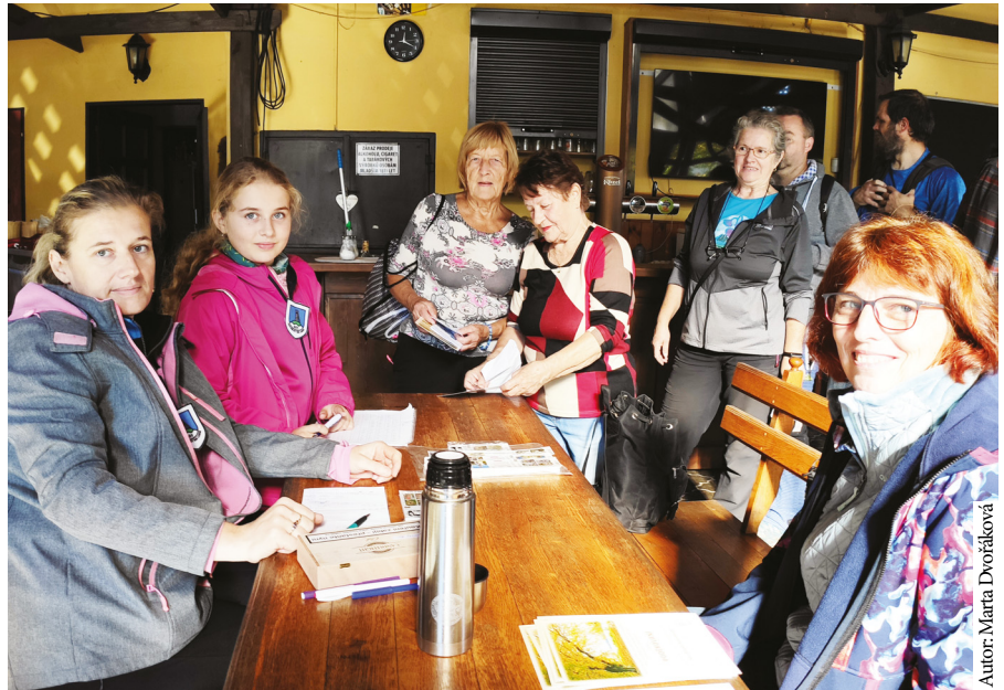
Autor: Marta Dvořáková

Letošní zajímavostí je, že poslední kontrola je v kostele, což bylo i loni, ale dnes bude pochodníky při komentovaných prohlídkách doprovázet i ladná hudba. Přišel totiž i pan varhaník a tak se nádherné tóny rozléhají po celé naší kontrole. Čas plyne, někteří se stále prezentují na startu, zároveň už jiní docházejí do cíle. Honza se také vydal na trasu, aby pořá-