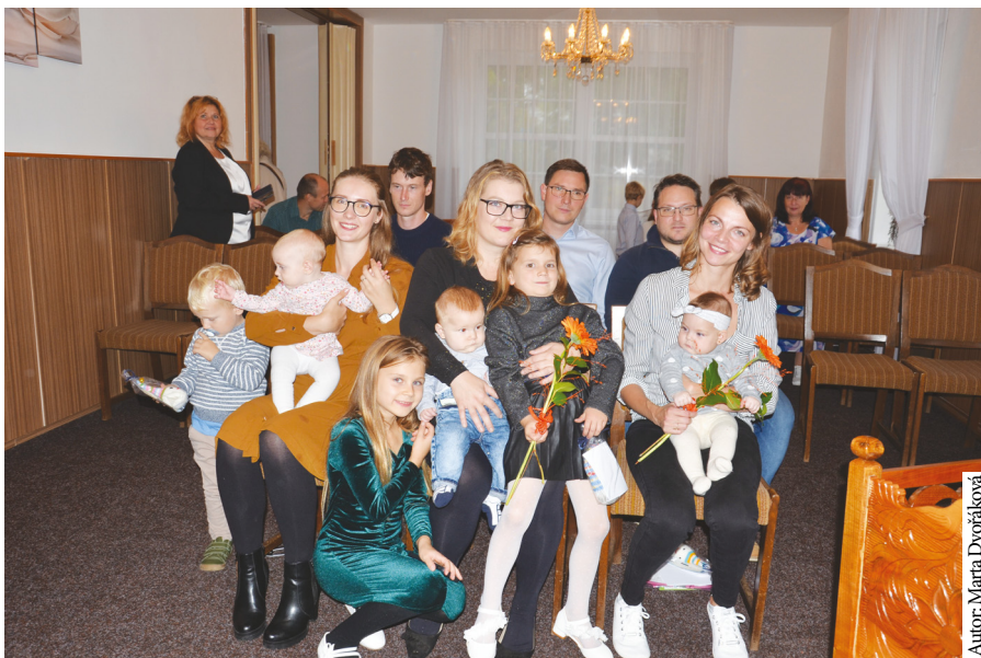
Autor: Marta Dvořáková