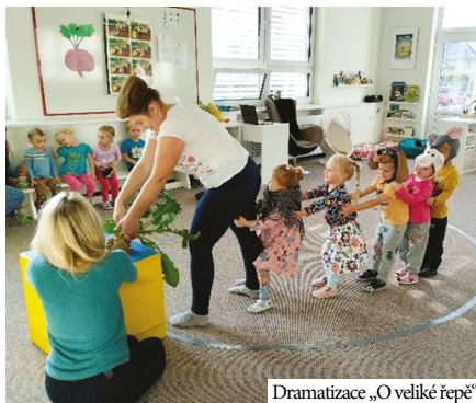
Dramatizace „O veliké řepě“