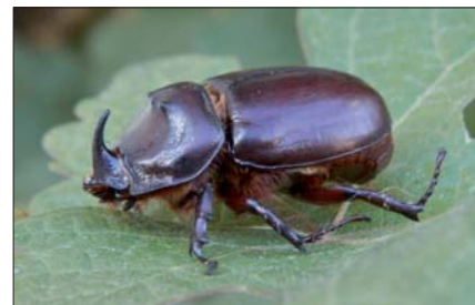
Nosorožík kapucínek 27.5.2017 Kostomlaty

Oba zmiňované druhy brouků byli v minulosti poměrně vzácné, díky ničení luk a sta-