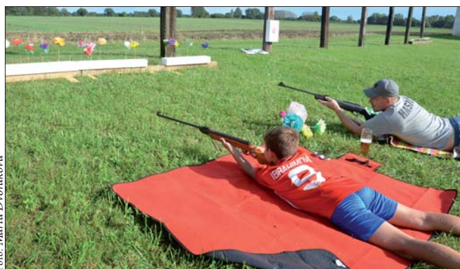
Lánské posvícení 2017