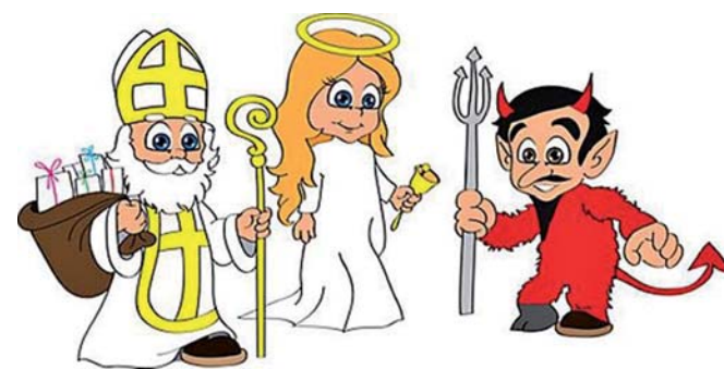
TJ Sokol Kostomlaty oddíl kopané připravuje 4. prosince 2017