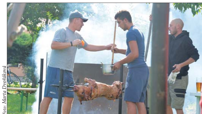
Lánské posvícení 2017