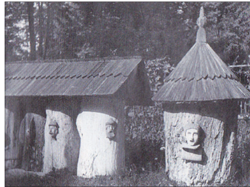
KLÁTY Z OBLASTI NĚMECKÉHO OSÍDLĚNÍ