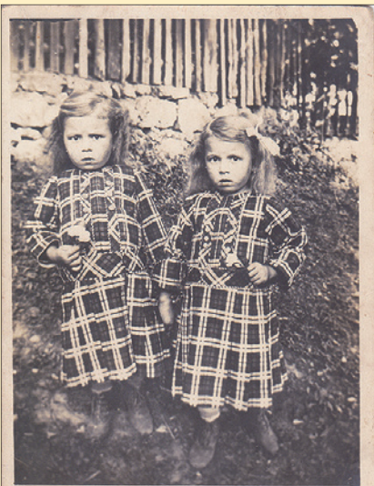
Dva přátel! Přijmi ti od nás srdečný pozdrav. Posílám Vám naše děti.