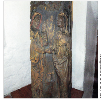
KLÁT Z DOBRUŠKY