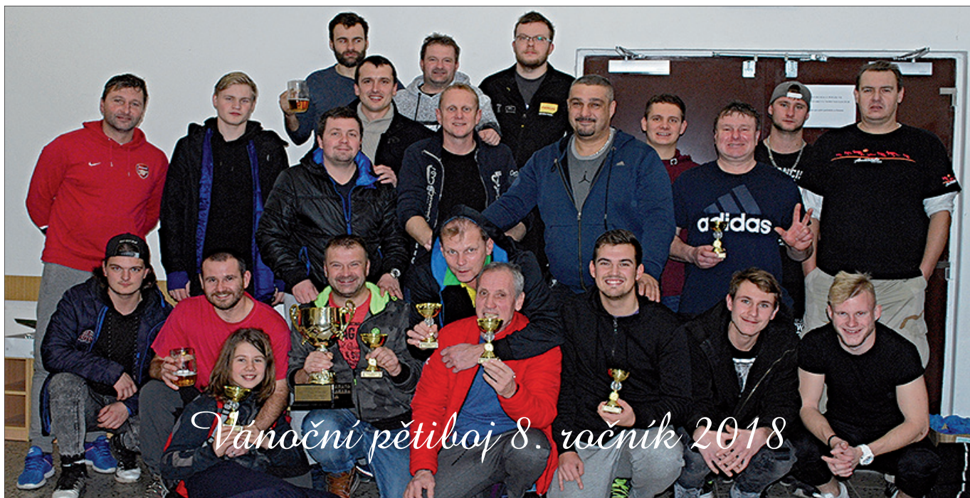
Vánoční pětiboj 8. ročník 2018