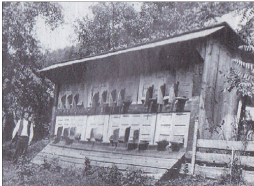
VČELÍN Z VALAŠSKA