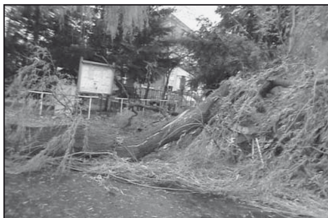
V listopadu se poryvem větru zlomila větev vrby u obecního úřadu.