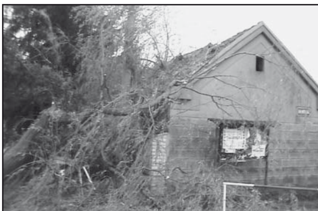
Spadlá větev způsobila škody na soukromém majetku.

(pozn.: příspěvek byl napsán již v létě)