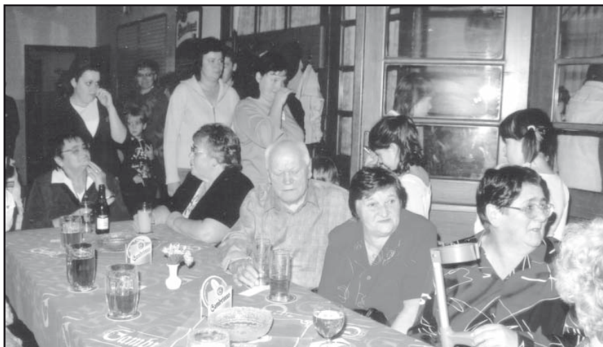
Všichni účastníci se zájmem sledovali vystoupení žáků ZŠ