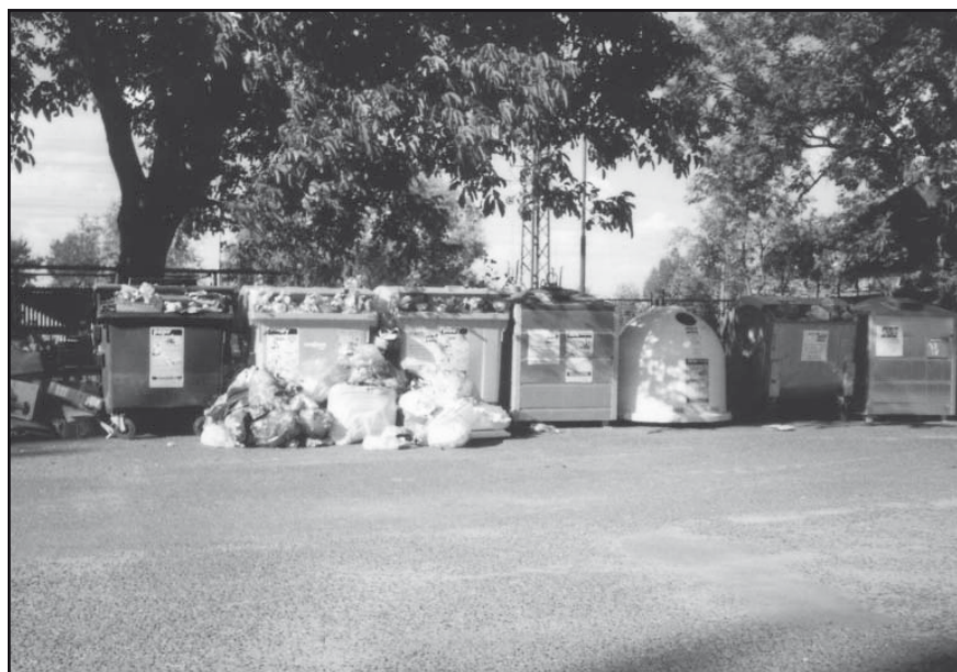
Přeplněné kontejnery u nádraží.