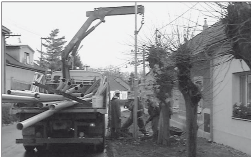
Stavění stožárů veřejného osvětlení

mu pracovníci firmy VaK namontují vodoměr. Jeden metr hadice stojí 23,- Kč , přesto není příjemné se s lidmi dohadovat, že mají na svém pozemku o půl metru méně hadice, že víc hadice nezaplatí a podobně. Přitom již nyní průměrná cena za jednu přípojku vychází už na zhruba 14 000,- Kč. Občané, kteří se přihlásili v první vlně, zaplatili příspěvek 8 000,- Kč, v dalším období příspěvek činil 12 500,- Kč. Rozdíl samozřejmě hradí obec. Když se před lety uvažovalo o připojení Kostomlat na vodovod, řada lidí tvrdila, že je vodovod zbytečný. Původní projekt počítal v Kostomlatech s 235 přípojkami, v dalším období se řada lidí odhlásila. Letos, když již vodovod nabral reálnou podobu, se někteří další ještě přihlásili, takže se bude kolaudovat celkem 253 vodovodních přípojek. Kromě těchto je ještě v obci 6 dalších přípojek, kdy se občané pozdě přihlásili, a proto si všechno vyřizovali sami, včetně projektu a povolení na MěÚ. Celou přípojku si samozřejmě hradili sami, obec nic nepřispěla. Bylo to možné také proto, že v té které lokalitě se zrovna přípojky prováděly.