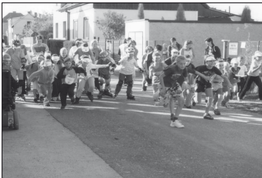
Start závodu BTF