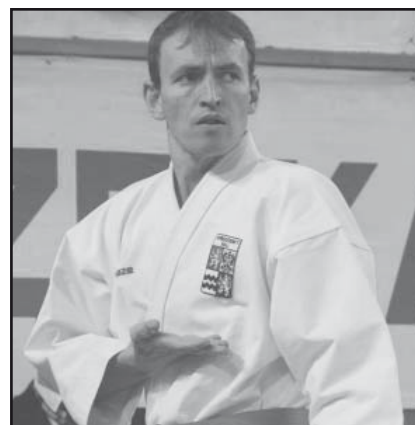
Účastník turnaje v akci

Závěrem patří také poděkování našim sponzorům, kteří tuto soutěž podpořili: Středočeský Krajský úřad, Městský úřad Nymburk, Mediální