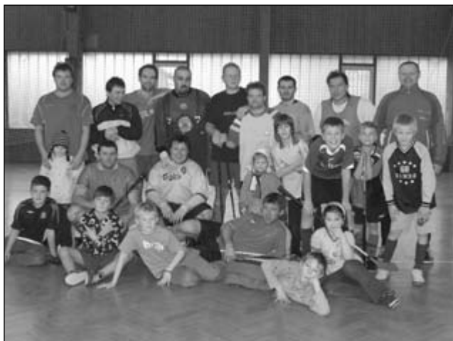
Vánoční sedmiboj v hale BIOS.