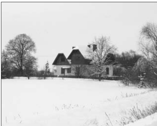
Zasněžená hájovna vypadá pohádkově.