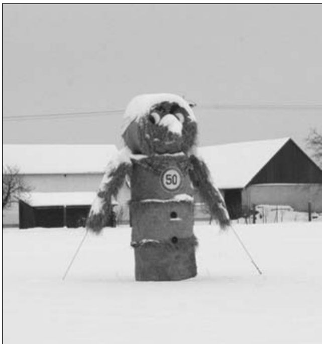
Rychlost vozidel v obci Lány hlídá i v zimním období panák ze slámy.