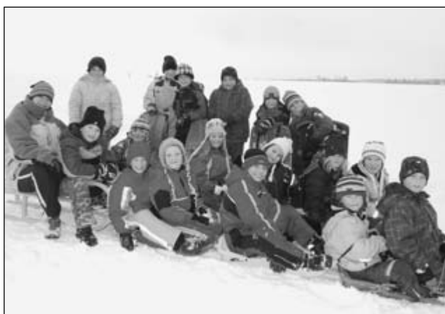
I takhle může vypadat hodina tělesné výchovy.