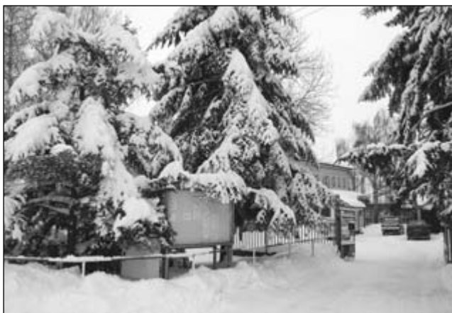
Zimní pohled na okolí obecního úřadu.